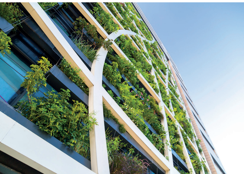
Illustration non contractuelle ne constituant pas un engagement quant aux futures acquisitions de la SCPI.